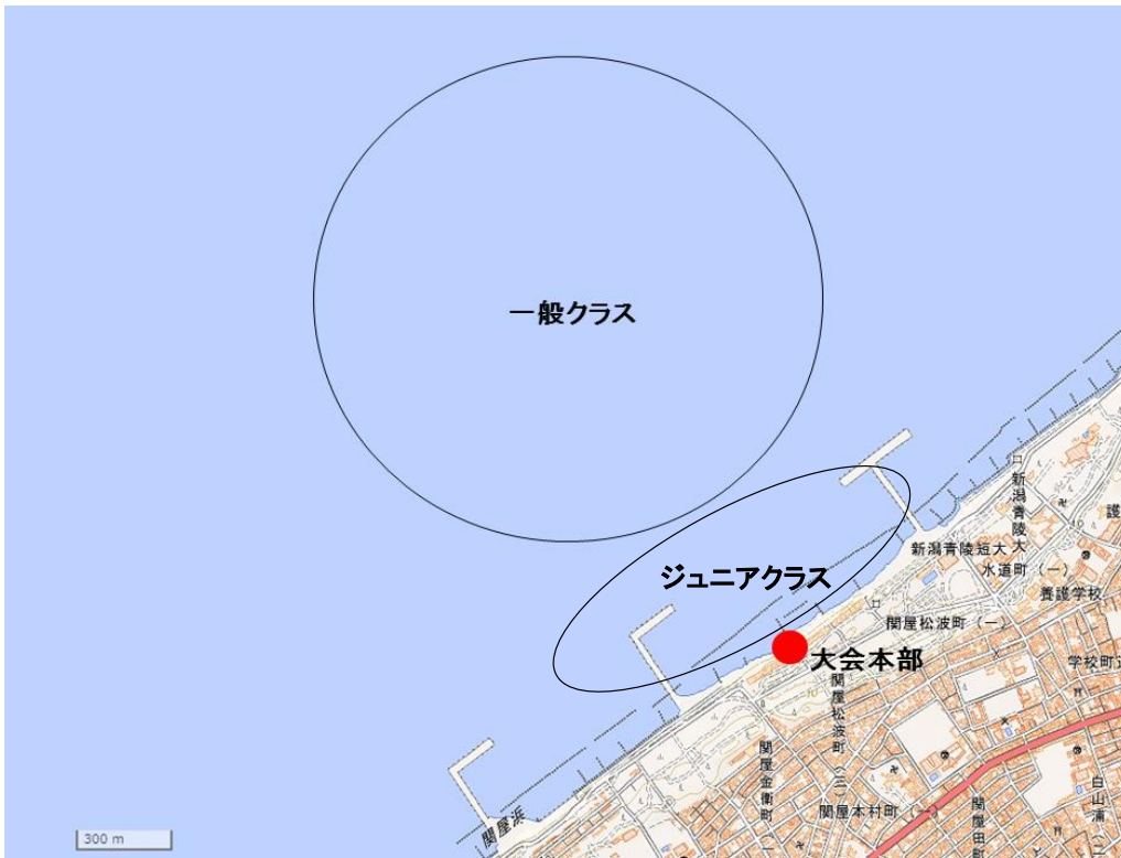
添付図B コース見取り図